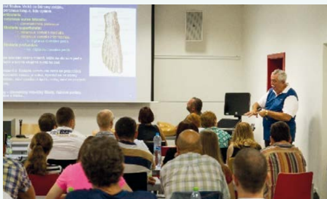
Přednáška Cadaver workshop