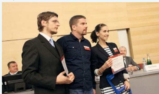
Vítězné Ceny Jiřího Macha