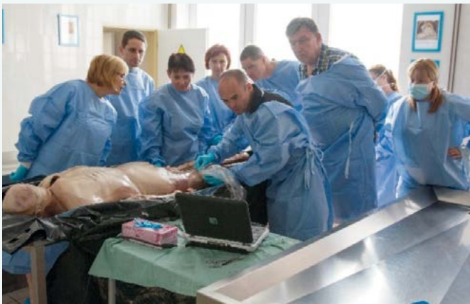
Cadaver workshop na pitevňě